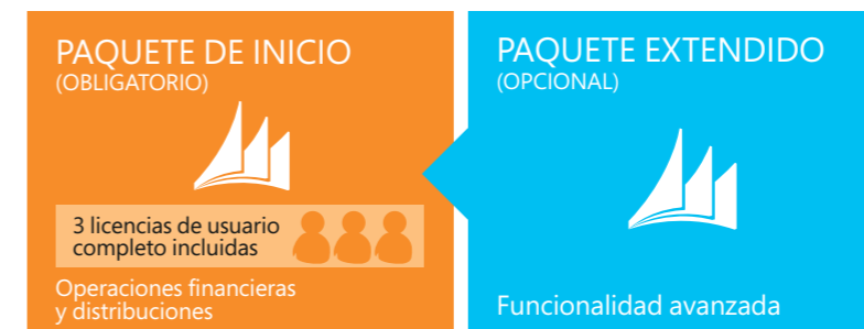
Figura 4: Paquete extendido

Los tres primeros usuarios completos incluidos en el Paquete de inicio tienen acceso a toda la funcionalidad incremental.