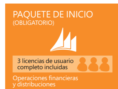
Figura 3: Paquete de inicio

Para muchas empresas este es el único componente de licencia necesario.