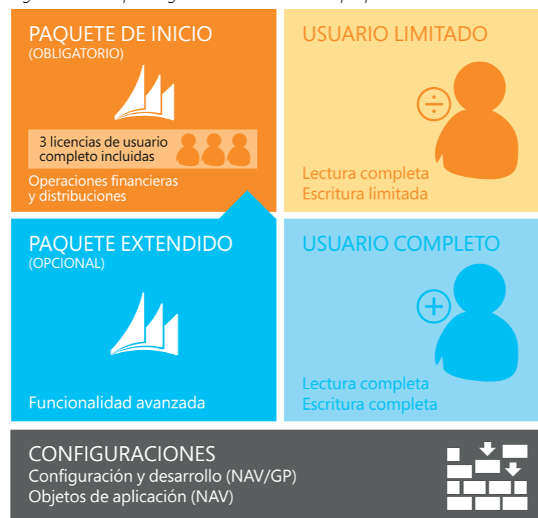
Figura 1: Descripción general de las licencias perpetuas